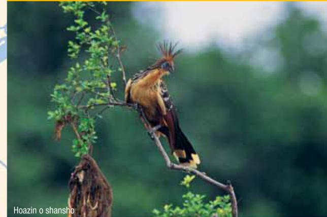
Hoazin o shansho

Disfrute la exuberancia de la Amazonía peruana. Vista ropa ligera, sombrero y calzado cómodo. Recuerde usar repelente contra insectos. Es recomendable que tanto turistas nacionales como extranjeros se vacunen contra la fiebre amarilla diez días antes de viajar a la selva.