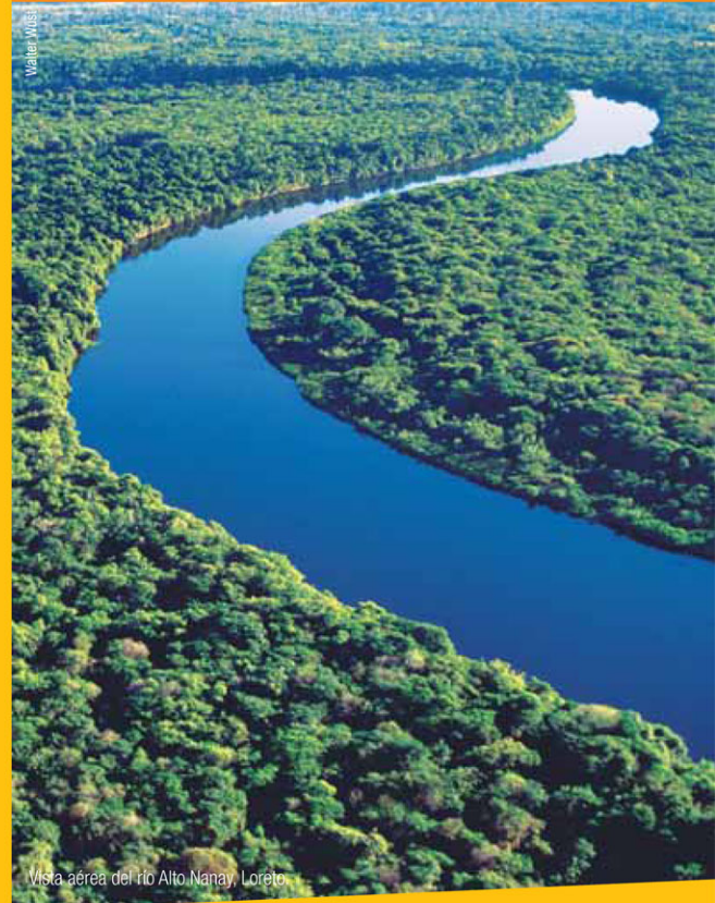
Vista aérea del río Alto Nanay, Loreto.