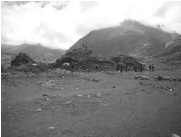
Figura 2. Restos arqueológicos de Honcopampa

en el marco del Callejón de Huaylas. Pese a los esfuerzos de la comunidad local, no se ha podido controlar el daño que ocasionan los visitantes a dichos restos al subirse sobre los mismos, así como de la basura que dejan en las inmediaciones. (ver Figura 2)